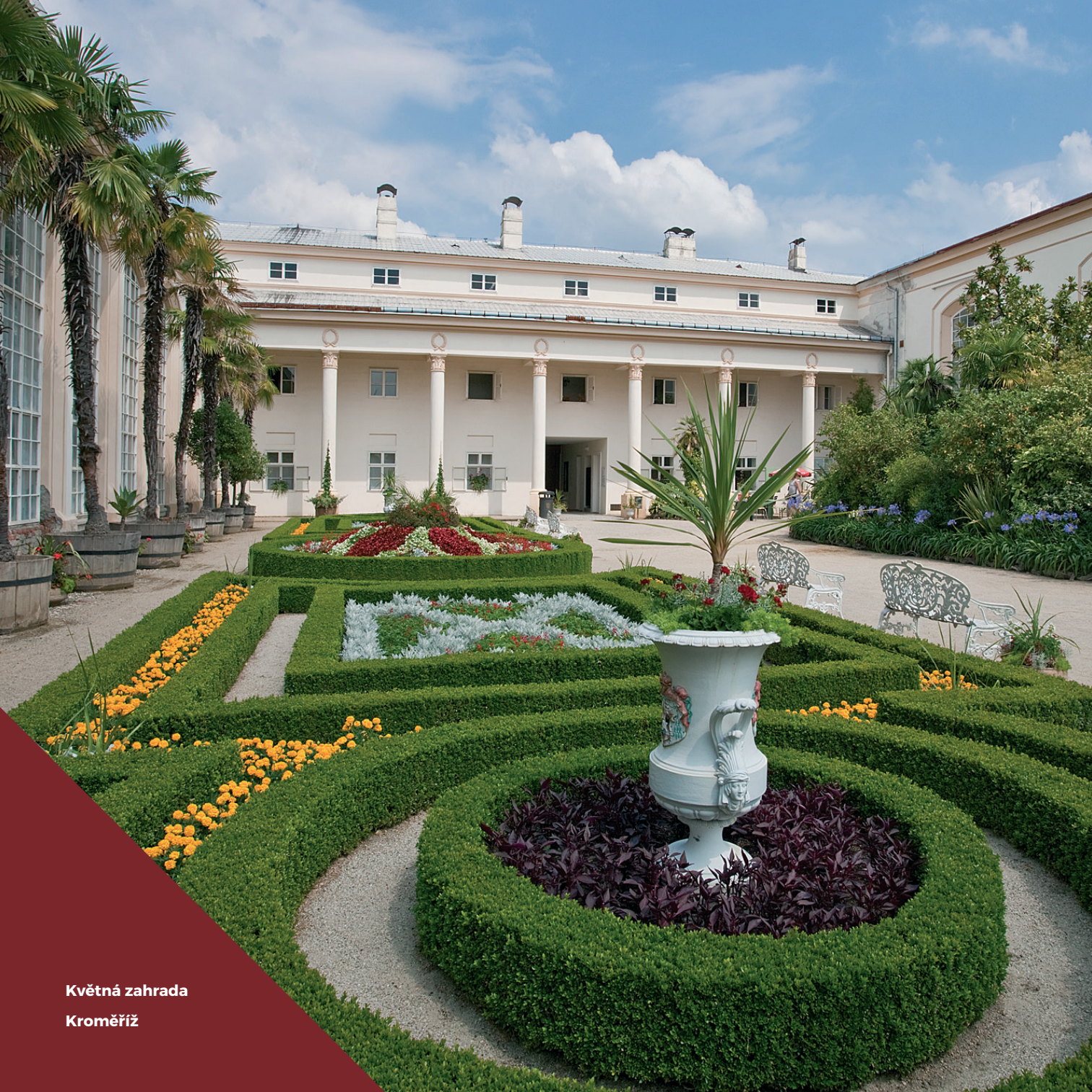
Květná zahrada Kroměříž