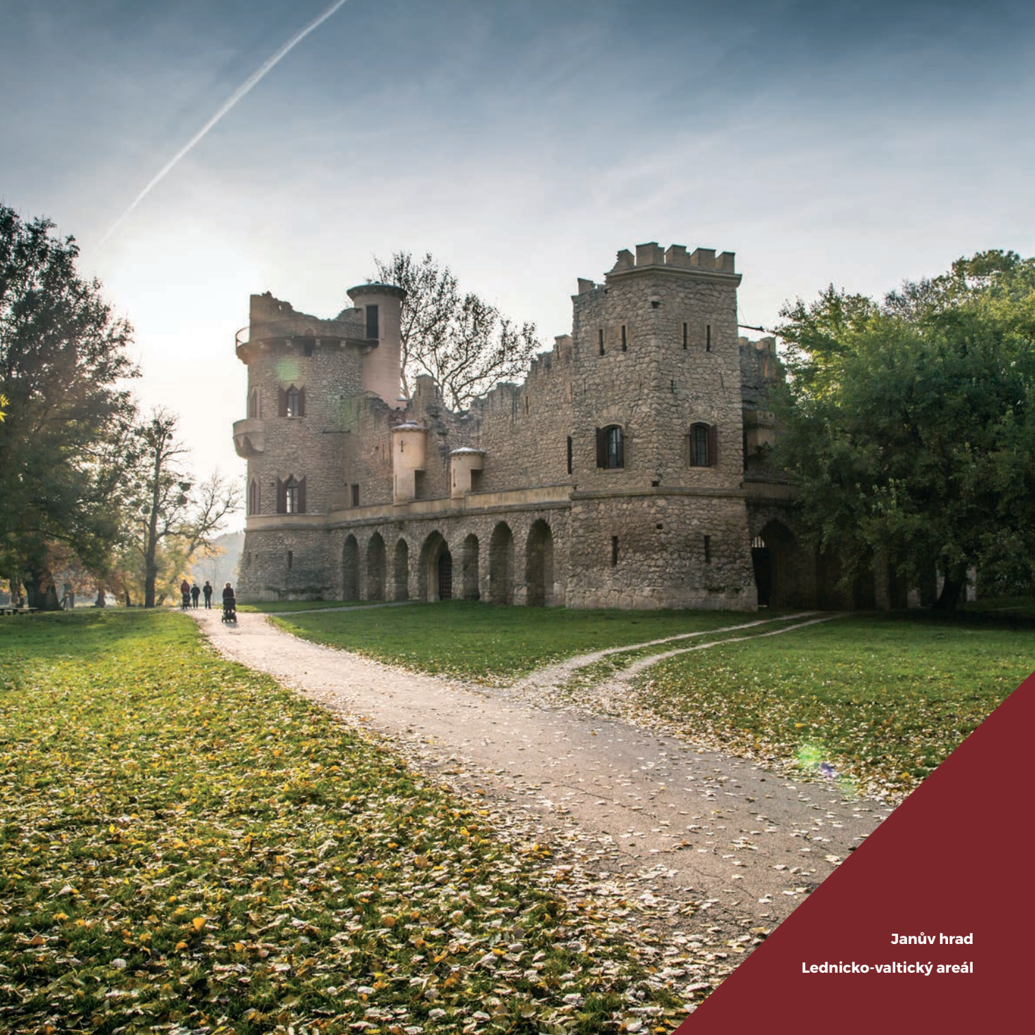
Janův hrad Lednicko-valtický areál